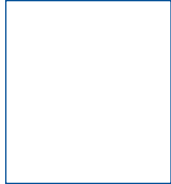
ਬਿਨੈਕਾਰ (ਹਾਇਰਰ) ਦੀ ਫੋਟੋ

ਘੋਸ਼ਣਾ: ਮੈਂ/ਅਸੀਂ ਸੁਰੱਖਿਅਤ ਡਿਪੋਜਿਟ ਲਾਕਰਾਂ ਨਾਲ ਸਬੰਧਤ ਨਿਯਮਾਂ ਅਤੇ ਸ਼ਰਤਾਂ ਨੂੰ ਪੜ੍ਹਿਆ, ਸਮਝ ਲਿਆ ਹੈ। ਮੈਂ/ਅਸੀਂ ਇਹਨਾਂ ਨਿਯਮਾਂ ਅਤੇ ਸ਼ਰਤਾਂ ਨਾਲ ਬੰਨ੍ਹੇ ਰਹਿਣ ਲਈ ਸਵੀਕਾਰ ਕਰਦੇ ਹਾਂ ਅਤੇ ਸਹਿਮਤ ਹਾਂ। ਮੈਂ ਸਹਿਮਤ ਹਾਂ ਕਿ ਬੈਂਕ ਮੇਰੇ/ਸਾਡੇ ਖਾਤੇ ਵਿੱਚ ਜਿੱਥੇ ਵੀ ਲਾਗੂ ਹੁੰਦਾ ਹੈ, ਸਰਵਿਸ ਚਾਰਜ ਅਤੇ ਟੈਕਸ ਡੇਬਿਟ ਕਰ ਸਕਦਾ ਹੈ। ਮੈਂ/ਅਸੀਂ ਇਸ ਦੁਆਰਾ ਘੋਸ਼ਣਾ ਕਰਦੇ ਹਾਂ ਕਿ ਉਪਰੋਕਤ ਵੇਰਵੇ ਸਹੀ ਹਨ। ਕਿਰਾਏ ਅਤੇ ਹੋਰ ਖਰਚਿਆਂ ਦੀ ਮੌਜੂਦਾ ਸਮਾਂ-ਸਾਰਣੀ ਮੈਨੂੰ/ਸਾਡੇ ਦੁਆਰਾ ਪ੍ਰਾਪਤ ਕੀਤੀ ਗਈ ਹੈ ਅਤੇ ਮੈਂ/ਅਸੀਂ ਇਸ ਨਾਲ ਸਹਿਮਤ ਹਾਂ। ਮੈਂ/ਅਸੀਂ ਅੱਗੇ ਸਮਝਦੇ ਹਾਂ ਅਤੇ ਸਹਿਮਤ ਹਾਂ ਕਿ ਟੈਰਿਫ/ਕਿਰਾਇਆ/ਹੋਰ ਖਰਚਿਆਂ ਵਿੱਚ ਬਾਅਦ ਵਿੱਚ ਹੋਣ ਵਾਲੇ ਕਿਸੇ ਵੀ ਬਦਲਾਅ ਨੂੰ ਬੈਂਕ ਦੁਆਰਾ ਆਪਣੀ ਵੈਬਸਾਈਟ ਅਤੇ/ਜਾਂ ਇਸ ਦੀਆਂ ਸਾਖਾਵਾਂ ਦੇ ਨੋਟਿਸ ਬੋਰਡਾਂ 'ਤੇ ਪ੍ਰਕਾਸ਼ਿਤ ਕੀਤਾ ਜਾਵੇਗਾ, ਜੋ ਕਿ ਅਜਿਹੇ ਸਬੰਧ ਵਿੱਚ ਮੇਰੇ/ਸਾਡੇ ਲਈ ਕਾਫੀ ਨੋਟਿਸ ਹੋਵੇਗਾ। ਮੈਂ/ਅਸੀਂ ਘੋਸ਼ਣਾ ਕਰਦੇ ਹਾਂ ਕਿ ਅਸੀਂ ਸਮੇਂ-ਸਮੇਂ 'ਤੇ ਲਾਗੂ ਸੁਰੱਖਿਅਤ ਡਿਪੋਜਿਟ ਲਾਕਰਾਂ ਦੇ ਸਬੰਧ ਵਿੱਚ ਭਾਰਤੀ ਰਿਜ਼ਰਵ ਬੈਂਕ/ਆਈਬੀਏ/ਇਨਕਮ ਟੈਕਸ/ਬੈਂਕ ਦੇ ਨਿਯਮਾਂ ਦੀ ਪਾਲਣਾ ਕਰਾਂਗੇ।